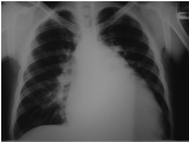
Figura 1. Radiografía PA de tórax que muestra cardiomegalia grado III y arteria pulmonar derecha prominente, sugerentes de hipertensión pulmonar.

izquierdas, insuficiencia aórtica, insuficiencia mitral y tricuspídea moderadas, hipertensión arterial pulmonar con presión sistólica del ventrículo derecho de 50 mmHg, y fracción de eyección del ventrículo izquierdo de 52%. Se le propuso tratamiento quirúrgico, al cual se negó, y se decidió su egreso con tratamiento médico. El paciente permaneció así los siguientes cuatro años, hasta que acudió al hospital por padecer exacerbación de la insuficiencia cardiaca congestiva. Al reingresar al servicio de medicina interna, en la exploración física se le encontró una frecuencia cardiaca de 84 por minuto, tensión arterial de 120/60 mmHg, frecuencia respiratoria de 22 por minuto y temperatura corporal de 36.5 °C. En el cuello se le notaba una presión venosa yugular de 15 cm por arriba de la orquilla esternal, con precordio hiperdinámico y frémito palpable, el choque de la punta desplazado a la izquierda y un soplo continuo de grado V/VI difuso. En el abdomen se notaba hepatomegalia de unos 8 o 9 cm por debajo del reborde costal; además, tenía reflujo hepatoyugular y edema en las extremidades inferiores.