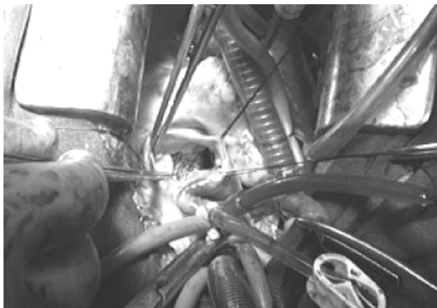
Figura 4. Imagen de la raíz de la aorta con un orificio en el seno no coronario, que corresponde a una ruptura del mismo (flecha negra) con comunicación al ventrículo derecho.

La operación inició con esternotomía media, bajo circulación extracorpórea, en hipotermia moderada a 28°C, utilizando protección miocárdica con cardioplejía sanguínea fría por vía anterógrada y retrógrada, y cardioplejía sanguínea caliente antes del despinzamiento aórtico. Se realizó el abordaje por la aurícula derecha. Se localizó el saco aneurismático roto en el techo de la aurícula derecha y se reparó con sutura continua de Prolene® 4-0 (Ethicon®, Somerville, N.J.). Después se realizó la aortotomía transversa y a través de la válvula aórtica se identificó una comunicación interventricular tipo conal por debajo de la valva coronaria derecha de 2.5 cm de diámetro, la cual se corrigió con un parche de Dacron® (Edwards Lifesciences Inc.®, Irvine, Ca.) colocado con sutura continua de Prolene® 4-0 (figura 4).