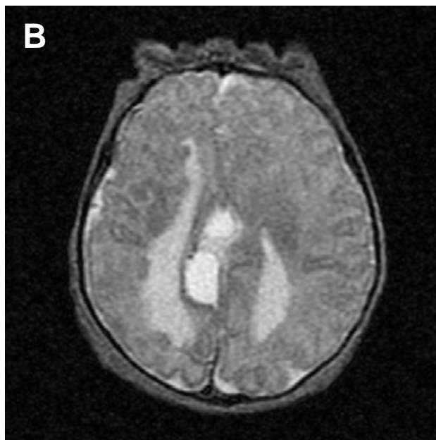
Figura 2a y 2b. Resonancia magnética que evidencia ventriculomegalia y ausencia del cuerpo caloso. Se observa un quiste interhemisférico que en ocasiones se manifiesta en pacientes con agenesia del cuerpo caloso.